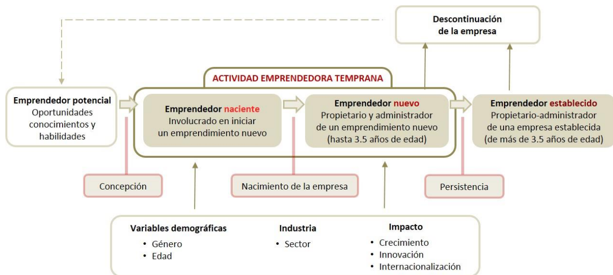
Figura 2. El proceso emprendedor

El conjunto de la población adulta es considerado como emprendedores potenciales. A partir de las oportunidades que identifican en su contexto económico, así como de sus conocimientos y habilidades, una proporción de esa población concibe un proyecto emprendedor y da los primeros pasos para llevarlo a cabo. Son los emprendedores nacientes. Parte de esas iniciativas no llegarán a buen término y cesarán al poco tiempo, pero otras se constituirán en emprendimientos que generan ingresos de forma estable para sus propietarios. Si la iniciativa empresarial cumple al menos tres meses pagando salarios o beneficios a su propietario, se considera ya un emprendimiento nuevo. Esta categoría incluye a las empresas que tienen entre tres meses y tres años y medio de vida. A partir de este momento se consideran ya empresas establecidas. El índice de Actividad Emprendedora Temprana (TEA) mide la proporción de la población que está participando en alguna de estas dos categorías, los emprendedores nacientes y los nuevos, es decir abarca los emprendedores desde que todavía están en fase de concepción de su proyecto y realizando sus gestiones iniciales, hasta que su iniciativa cumple tres años y medio de operaciones.